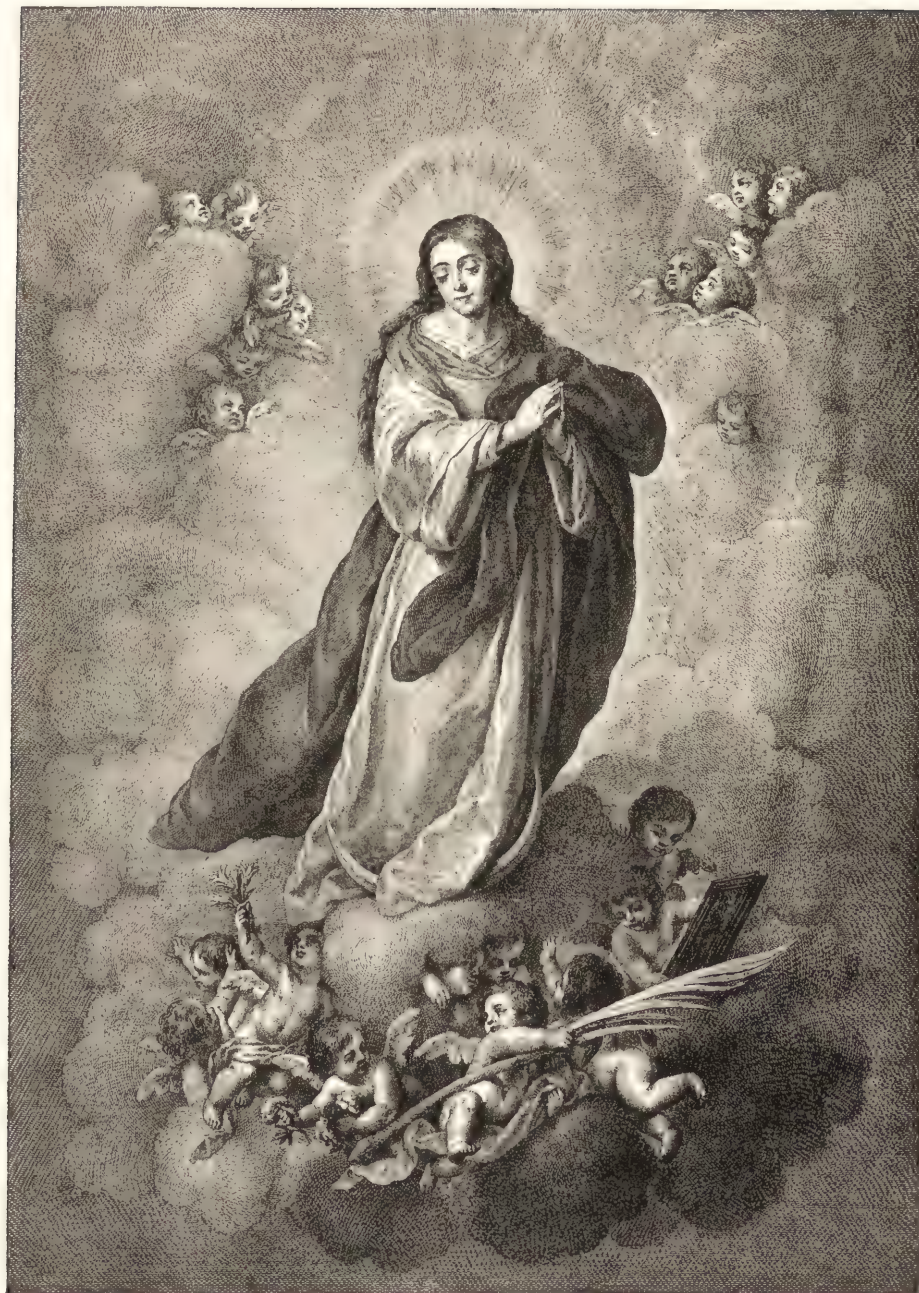
L'IMMACULÉE CONCEPTION. (Musée de Madrid.)